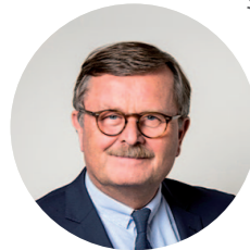
Prof. Dr. Frank Ulrich Montgomery, Präsident der Bundesärztekammer

„Klimaschutz ist eine gesamtgesellschaftliche Aufgabe, die auch das Gesundheitswesen mitträgt. Daher freue ich mich, dass die Stiftung viamedica mit ihrem Projekt alle Beschäftigten der Gesundheitsbranche mit in den Klimaschutzprozess einbindet. Beteiligen auch Sie sich und gehen Sie mit gutem Beispiel voran!“